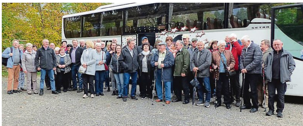
HOFFNUNG FÜR EINE NEUE GENERATION

Weitere Infos und Rückfragen per E-Mail an mhoss@xhope.de oder telefonisch unter 0176-10550001.