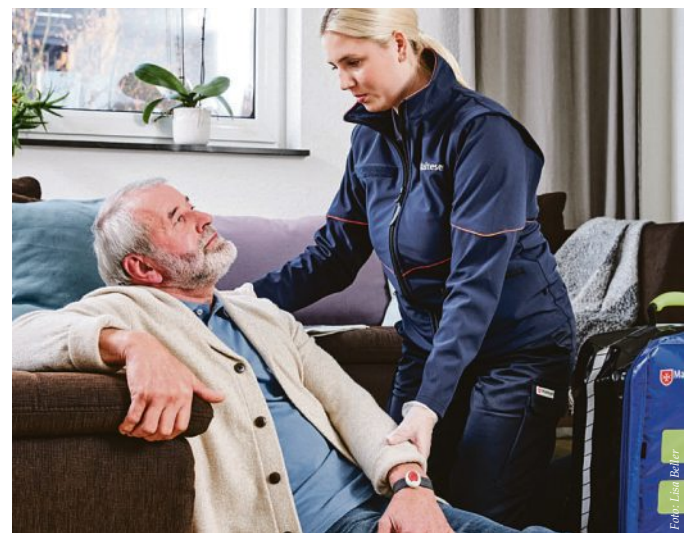
Der Malteser Bereitschaftsdienst ist immer einsatzbereit.