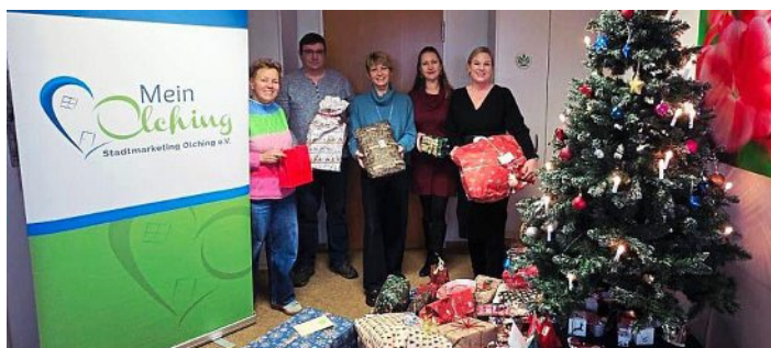
Bei der Wunschbaumaktion.