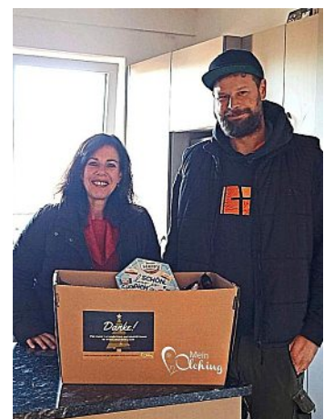
Ein Dankeschön für die Bauhof-Mitarbeiter.