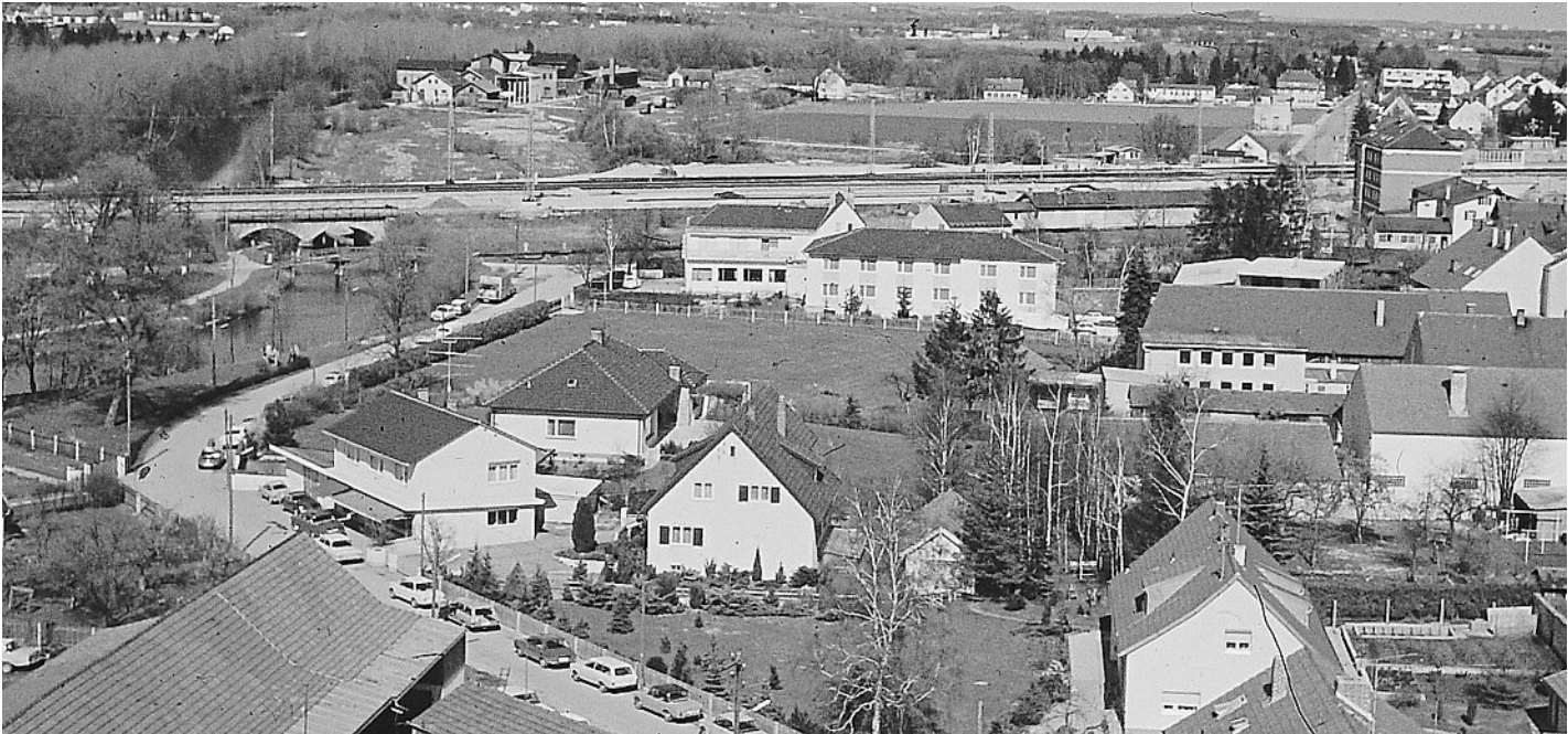
Blick nach Nordosten in Richtung Geiselbullach