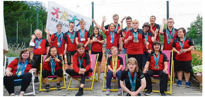
Die EbK Sportlerinnen und Sportler bei der vereinsinternen Siegesfeier.

Natürlich gehörten auch die 28 Aktiven der Delegation des Kreis Eltern behinderter Kinder Olching e.V (EbK), zu den rund 1.500 Sportlerinnen und Sportler aus den sieben Regierungsbezirken Bayerns. Den hochsommerlichen