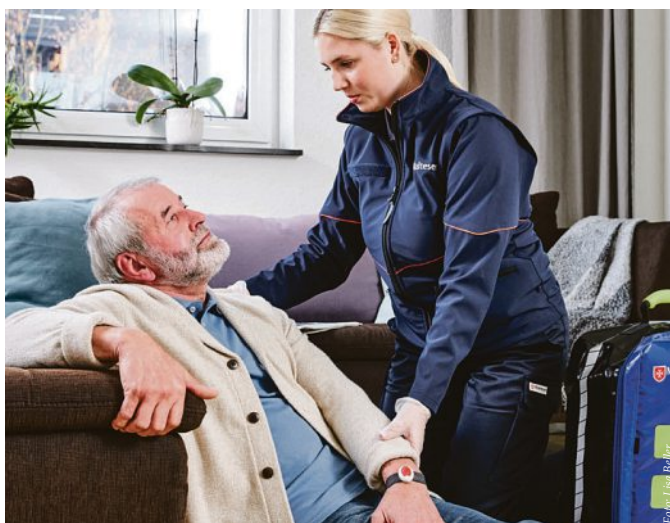
Der Malteser Bereitschaftsdienst ist immer einsatzbereit.

Mit dem Malteser Hausnotruf können ältere und beeinträchtigte Menschen in Notfällen schnelle Hilfe holen. Ein Knopfdruck genügt und sofort wird Sprechkontakt zur Hausnotrufzentrale der Malteser aufgebaut. Erfahrene Mitarbeitende schicken genau die richtige Hilfe. Das kann der Bereitschaftsdienst sein, eine Vertrauensperson oder im Ernstfall der Rettungsdienst.