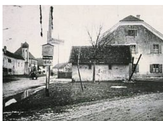
Esting um 1920