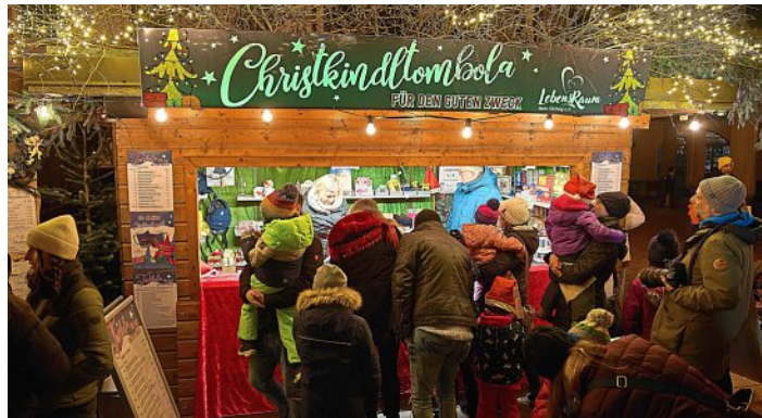
Die Tombola-Hütte auf dem Olchinger Christkindlmarkt.