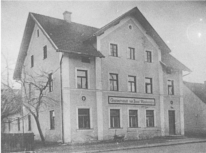
Gastwirtschaft Westermayer Mitte der 1930er Jahre.

Als die Traditionswirtschaft zusammen mit den dahinter liegenden Ökonomiegebäuden der Familie Westermayer 1979 abgerissen wurde, war das Entsetzen in Olching groß. In der beliebten Gastwirtschaft konnten die Schulbuben lange Zeit das Bier für Ihre Väter zu Hause im eigenen Bierkrug abfüllen lassen. Ursprünglich war die Gaststätte als zweites finanzielles Standbein neben der Landwirtschaft errichtet worden und das Aushängeschild des Fürstenfeldbrucker Marthabräus.