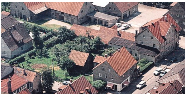
Luftbild von 1969 mit den landwirtschaftlichen Gebäuden (oberer Bildrand) und Gasthaus mit Ladenanbau.