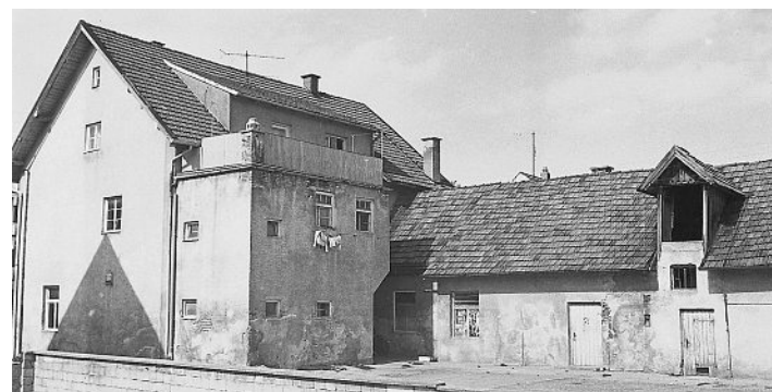
Die Rückseite mit dem Schlachthausanbau kurz vor dem Abbruch.