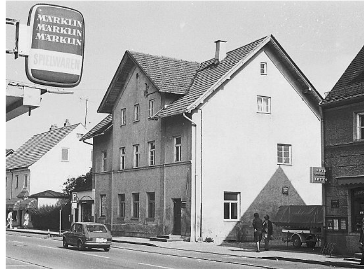
Das ehemalige Gasthaus 1978.