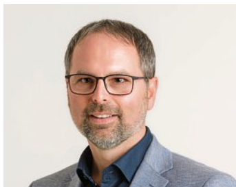
Andreas Magg (Erster Bürgermeister)