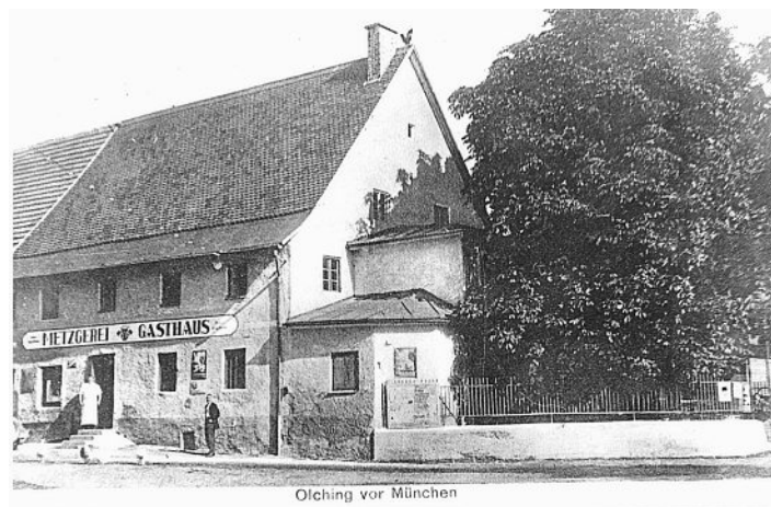
Gasthaus und Metzgerei um 1935.

1911 wurde im Lokal auf Initiative von Olchings erstem Pfarrer Georg Böhmer von 30 namhaften Bürgern der Spar- und Darlehensverein Olching und somit das älteste Geldinstitut Olchings gegründet. Beim Bombenangriff am 22. Februar 1944 wurde vor allem der rechte Gebäudeteil schwer beschädigt, direkt nach Kriegsende wurden oben im Saal 36 Flüchtlinge mehr schlecht als recht untergebracht. Einige Jahre später wurde anlässlich eines großen Sommerfestes – dem Vorläufer des späteren Volksfestes – neben Fahrgeschäften auf der Insel in der Ausschankhütte im Streller-Biergarten der Glückshafen der Gemeinde für die Finanzierung der Ampersiedlung am Mühlbach installiert. 1950 wurde der Schützenverein Gemütlichkeit Olching im Gasthaus neu gegründet. Der Streller-Saal durfte aus Sicherheitsgründen bald nicht mehr für Schießzwecke genutzt werden – ein eigens errichteter Anbau diente dem Schützenverein dann von 1954 bis 1962