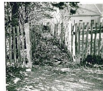
Streller-Gangl 1970.

als Vereinslokal. Bevor die Heckenstraße von der Schulstraße bis zur Hauptstraße Anfang der siebziger Jahre verlängert wurde, konnte ein schmaler Fußweg als Durchgang benutzt werden. Ältere Olchinger dürften sich an das „Streller-Gangl“ noch erinnern. Ebenso, dass bis 1976 der Maibaum vor dem Streller-Biergarten platziert war.