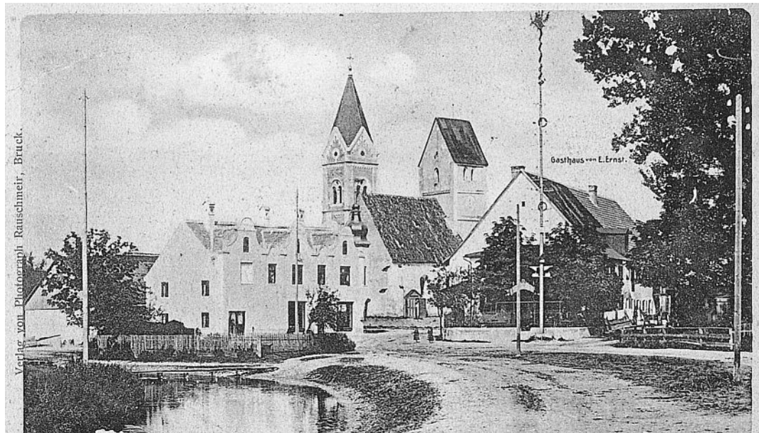
Aufnahme von 1903 mit Schramlbach, Kaufhaus Kahn und den zwei Pfarrkirchen. (Abbruch des alten Kirchleins 1904)