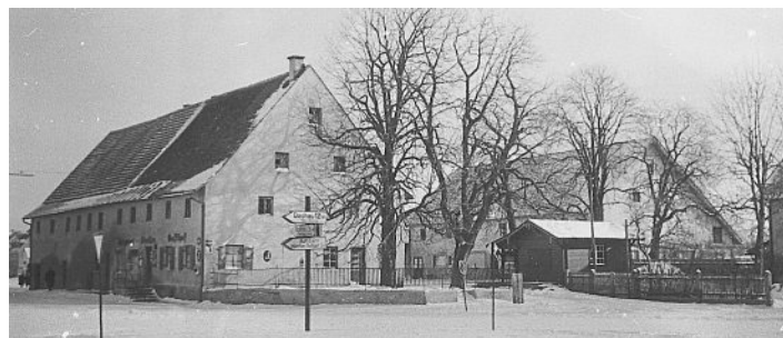
Gasthaus und Metzgerei Streller 1970.

als Vereinslokal. Bevor die Heckenstraße von der Schulstraße bis zur Hauptstraße Anfang der siebziger Jahre verlängert wurde, konnte ein schmaler Fußweg als Durchgang benutzt werden. Ältere Olchinger dürften sich an das „Streller-Gangl“ noch erinnern. Ebenso, dass bis 1976 der Maibaum vor dem Streller-Biergarten platziert war.