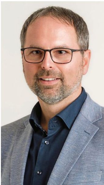
Andreas Magg Erster Bürgermeister