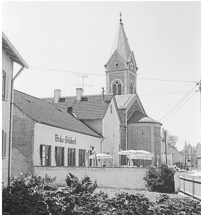
Das Bräustüberl neben der Kirche 1969.