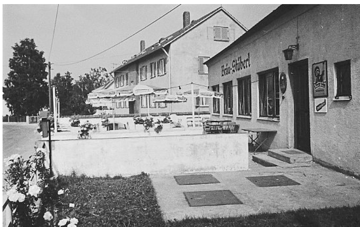
Ruhige Lage 1969.