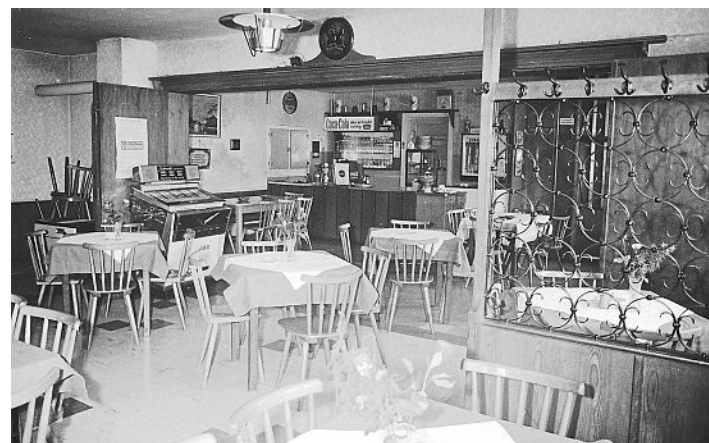
Die Gaststube 1969.