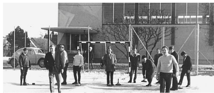
Eisstockschißen auf dem Hartspielplatz. Im Hintergrund die Turnhalle der Martinschule, 1971.