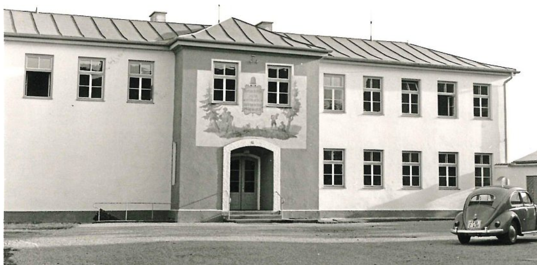
Die alte Knabenschule, ca. 1960.

1936 befand sich das Gebäude mit seinen sanitären Einrichtungen in einem desolaten Zustand und man überlegte, ob sich aufwendige Sanierungsarbeiten noch lohnten. Da in diesem Jahr auch die Einführung einer 8. Jahrgangsstufe im ländlichen Raum Pflicht wurde und zusätzliche Schulräume sowohl in der 1908 errichteten Mädchenschule als auch in der Knabenschule benötigt wurden, beschloss man die Schaffung einer Zentralschule durch einen neuen Trakt an der Mädchenschule. Außerdem war geplant, die Knabenschule in ein HJ-Heim umzuwandeln. Die Kosten für beide Vorhaben waren hoch, eine nicht ausgeführte Abwasserbeseitigungsan-