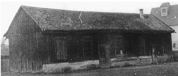
Turnhalle, um 1925.